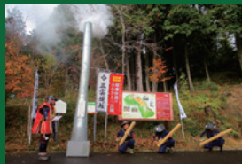
琵琶湖一周のろし駅伝