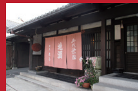
ラリーポイント(北島酒造)