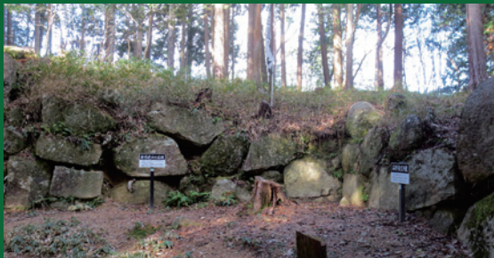
三雲城址(櫛形虎口)

当日は第18回琵琶湖一周のろし駅伝のスタート地点で午前10時に上げます。忍者の謎に迫りながら一日をお楽しみ下さい。