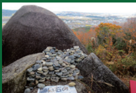
八丈岩の願い石(受験の神様)