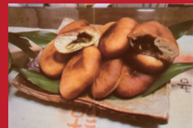
みちコン名物「にん忍パン」