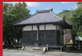
ラリーポイント(八島地藏堂)