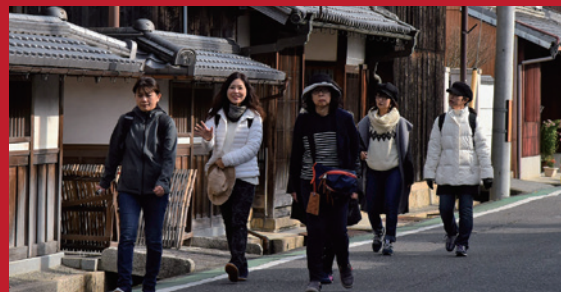
ウォークラリー(スタンプラリー)