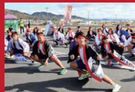
ソーラン踊り(前年風景)